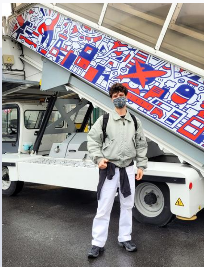
Le D posant devant sa fresque exposée sur l'un de nos escabeaux

Afin de célébrer cette étape significative, nous souhaitons qu'elle soit la plus inclusive possible, impliquant chacun de vous et partageant ensemble la joie de ces 30 ans d'accomplissements.